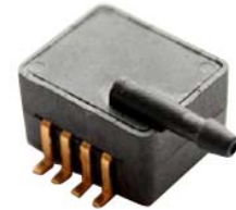
型号 XMP2P-xxx SOP8 封装, 气源接管平行表 面, 倒钩接头