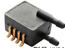
型号 XMP2D-xxx SOP8 封装, 双气源接 管, 双倒钩接头