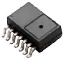
型号 XMP2E-xxx 封装 S01C14 无气源接管

XMP2F 压力传感器在单一芯片内集成封装了 MEMS 压力传感器和信号处理电路芯片 ASIC，ASIC 对传感器的偏移、灵敏度、温漂和非线性进行数字补偿，输出经过放大、校验、温度补偿后的电压信号，该信号以供电电压为参考，正比于压力输入。器件具有一致性好和重复性高等优点。