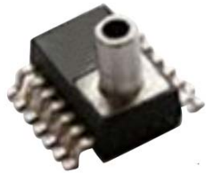
型号 XMP2F-xxx 封装 S01C14 有气源接管