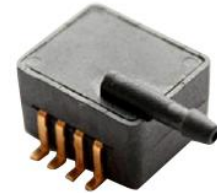
型号 XMP2P-xxx SOP8 封装, 气源接管平行表 面, 倒钩接头