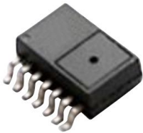
型号 XMP2E-xxx 封装 S01C14 无气源接管

XMP2F 压力传感器在单一芯片内集成封装了 MEMS 压力传感器和信号处理电路芯片 ASIC，ASIC 对传感器的偏移、灵敏度、温漂和非线性进行数字补偿，输出经过放大、校验、温度补偿后的电压信号，该信号以供电电压为参考，正比于压力输入。器件具有一致性好和重复性高等优点。