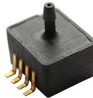
型号 XMP2V-xxx 封装 SOP8, 气源 接管垂直表面, 倒钩接头