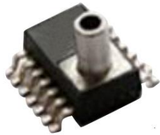
型号 XMP2F-xxx 封装 S01C14 有气源接管