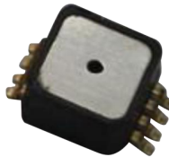
型号 XMP2N-xxx 封装 SOP8, 无气源接管